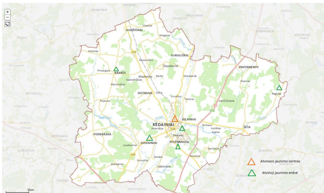
1 pav. Kėdainių rajono savivaldybėje veikiantys atvirieji jaunimo centrai ir atvirosios jaunimo erdvės.